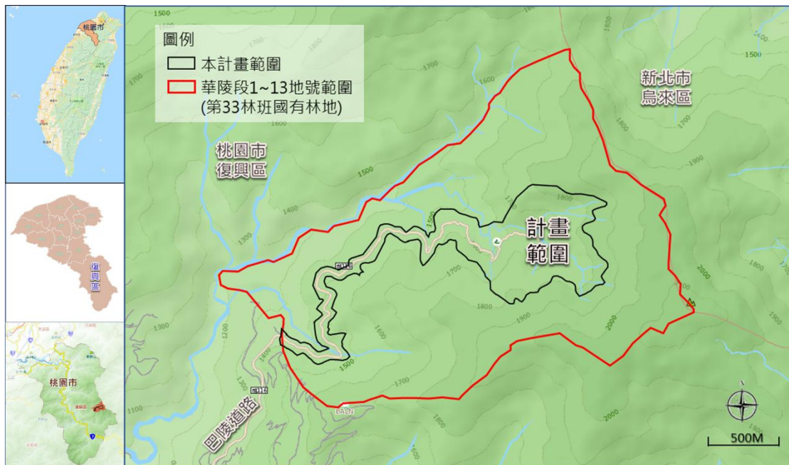
圖 1. 拉拉山國家森林遊樂區計畫範圍圖

本區範圍包含桃園市復興區巴陵段 1967~1979 地號等 13 筆土地及部分華陵段 1~2 地號等 2 筆土地，總面積為 81.59 公頃。