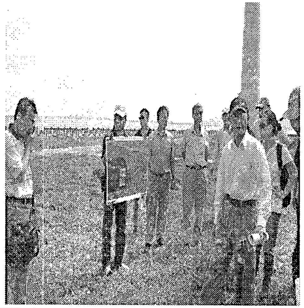
編號第 1105 號保安林解除範圍現地勘查情形