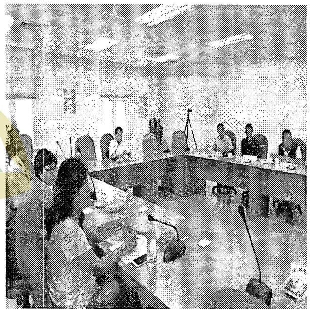
編號第 1105 號保安林第二次解除審議委員會辦理情形